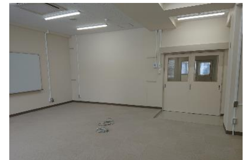
■ 学習生活支援センター前期分室