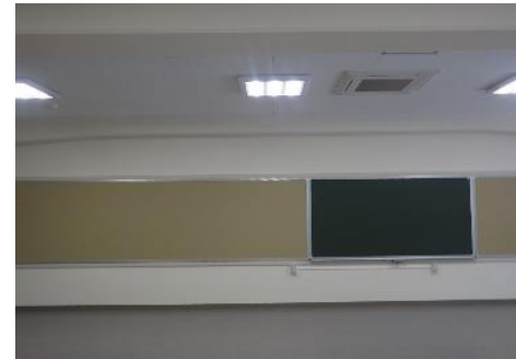
■ カンファレンスルーム