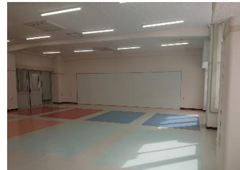
■ 未来創造科演習室