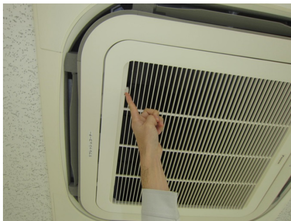
②蓋のロックを解除します