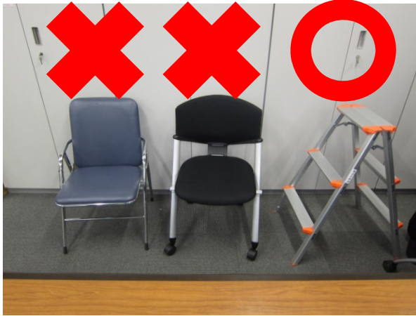
①安定した台を使用しましょう