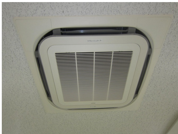
①天井埋込タイプの空調機