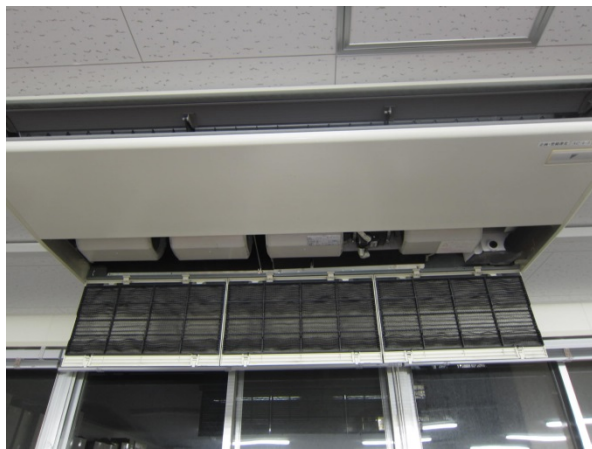
④フィルターの蓋を開けます