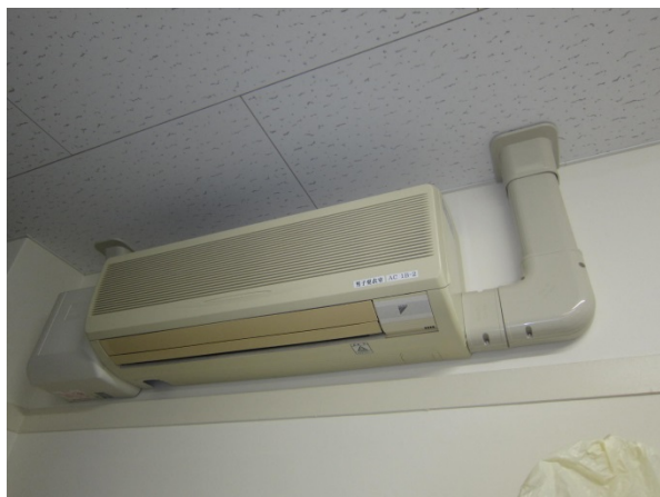
①壁掛けタイプの空調機