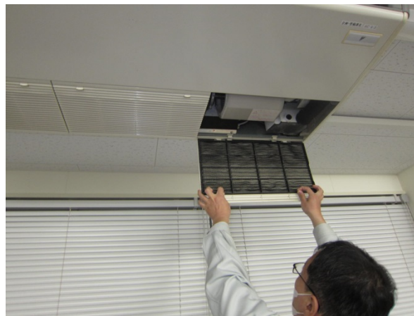
⑤フィルターを取外します