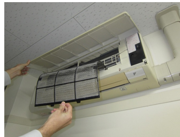
③フィルターを引っ張って取外し 清掃後元通りにはめ込みます