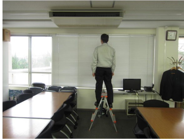
②安全を確認して台に上りましょう