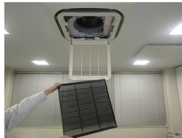
③蓋を開け、フィルターを取外し 清掃後元通りにはめ込みます