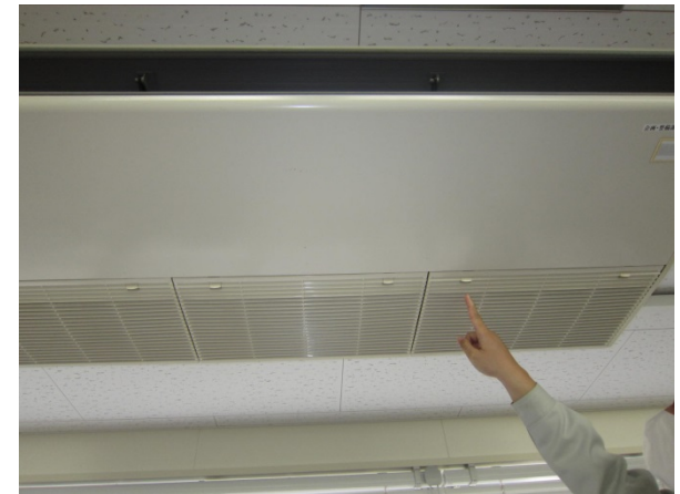
③蓋のロックを解除します