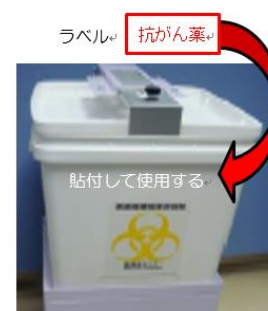
図 2. 抗がん薬専用の廃棄物容器