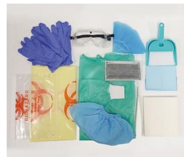
図 3. スピルキットは抗がん薬が大量にこぼれた時に使用