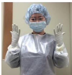
図 1. 抗がん薬取り扱い時の个人防护具

マニュアルには、抗がん薬の調製・調剤、運搬・保管、投与準備・投与における曝露防止手順が示され、抗がん薬を取り扱う際には、適切な个人防护具を使用するように定めています(図 1)。また、抗がん薬が付着した物品等の廃棄には専用の廃棄容器を用いることになりました(図 2)。加えて、