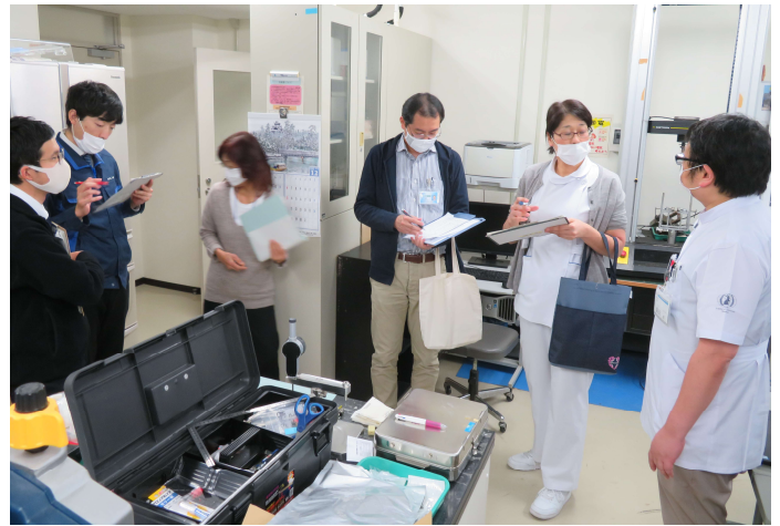
実際の監査の様子