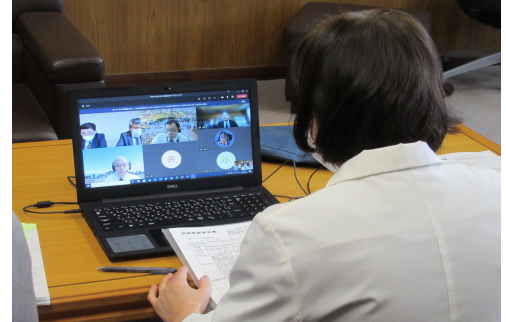
クロージングミーティングの様子