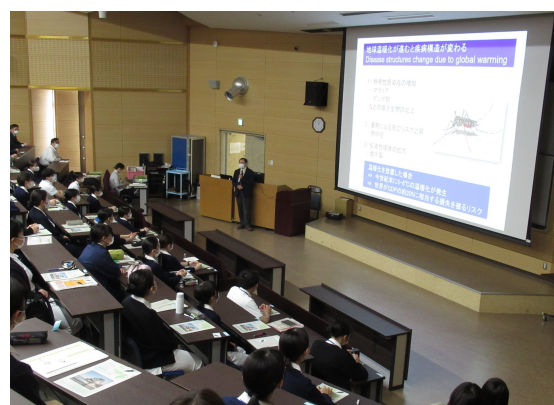
新任看護師、医療職員研修