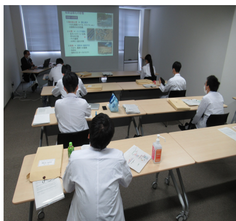
大学院新入生オリエンテーション研修