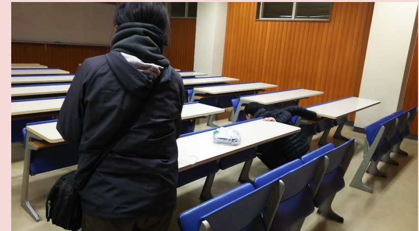
生物資源科学部3号館点検中

学生EMS委員会は、学内の環境を整えるために活動している団体です。 今回の活動に加え、毎週金曜日18:30～会議を行っております。 興味のある方は gakusei-ems@ml.shimane-u.ac.jp までご連絡ください。 お待ちしております。