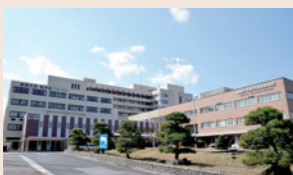
現在の島根大学医学部附属病院

島根大学医学部附属病院は、1979年に島根医科大学医学部附属病院として開院しました。開院以来30年を経て、ハード・ソフト両面で医療をめぐる環境は大きく変化し、建物の老朽化をはじめ、患者さんのニーズに応じた満足度の高い医療、快適な療養環境を提供することに支障が生じていました。そのため、2008年～2013年にかけて、新病棟の建設、既存病棟及び外来・中央診療棟の改修を行い、病院機能の強化を図ったほか、教育・研究環境も整備しました。