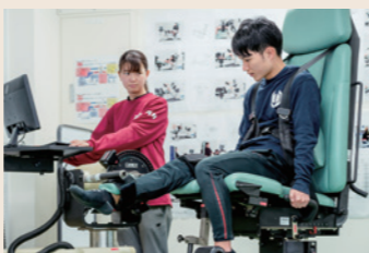
人間科学部での授業の様子