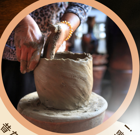
昔ながらの手づくりも応援！

島根県内の「ものづくり」に興味のある高校生・高専生を対象として、20万円を原資に作りたいものを作り、作ったものを社会の中でどう価値づけしていくのかなど、「起業」についても学ぶことのできるプログラムです。