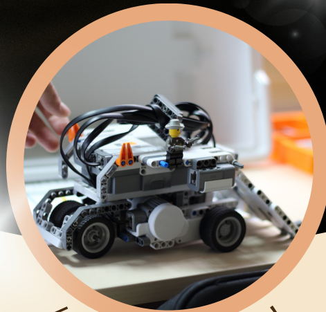
人助けの機械も応援！