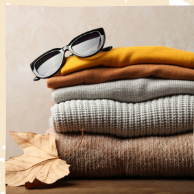
特殊染料を活用した衣服