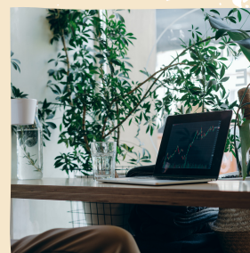
空家から出た資材を活用した机