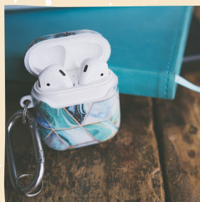
シリコン素材の AirPodsケース