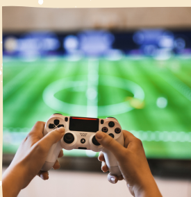
ゲームアプリ開発