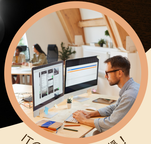
ITのサービスも応援！