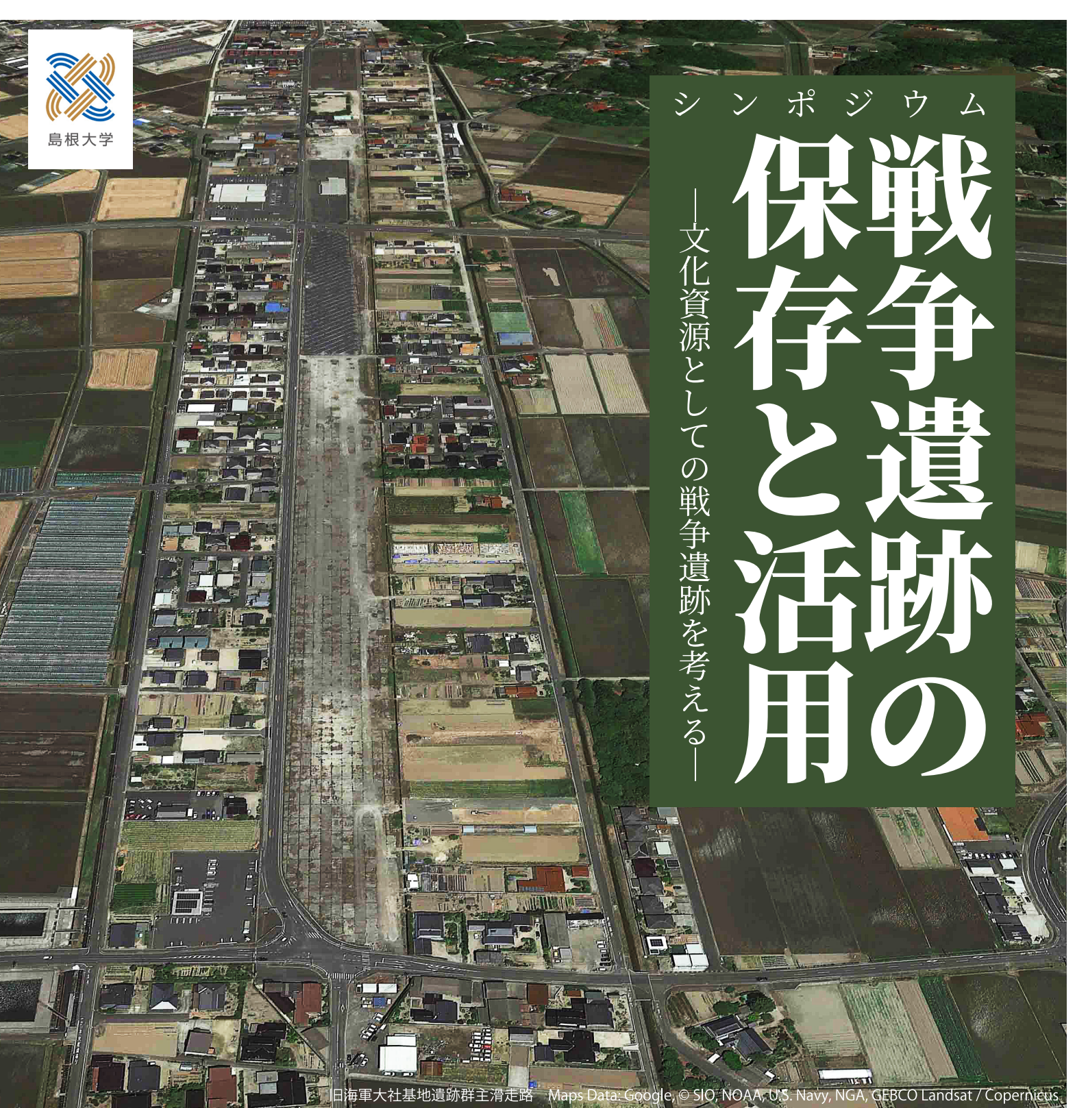
日海軍大社基地遺跡群主滑走路 Maps Data: Google, © SIO, NOAA, U.S. Navy, NGA, GEBCO Landsat / Copernicus