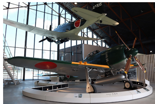
「sora かさい」の実物大模型