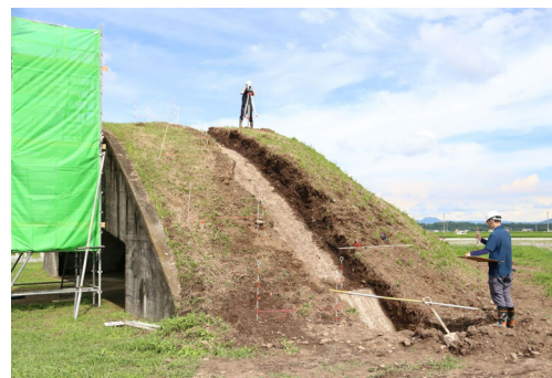
宇佐市城井1号掩体壕の発掘調査