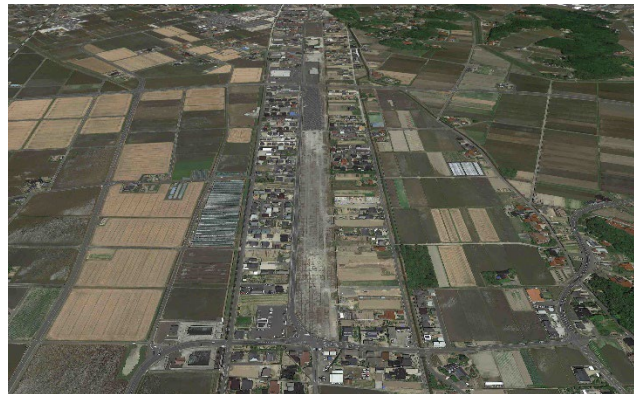
大社基地遺跡群主滑走路