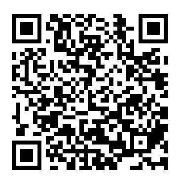
For SU members