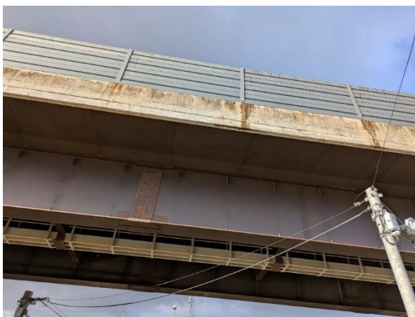
島根県の耐候性鋼橋梁

社会のあらゆる構造物や輸送機器、デバイスに使用されている金属材料は、周囲の環境によって劣化しない“耐環境性”が重要です。例えば、海浜環境では飛来海塩によってさびにくい材料が求められます。また、持続可能な未来社会では、水素を使う・作るときに安全に使用できる金属材料が必要となるはず。安心・安全な社会を構築し維持するために、主に、橋梁等に用いられる耐候性鋼や自動車・建材・家電等に用いられる亜鉛系めっき鋼などの鉄鋼材料の長寿命化に向けた電気化学的研究、高強度鋼等の水素脆化の防止に向けた表面処理や水素センサの開発、燃料電池や水電解装置の金属部材の腐食防食研究、ステンレス鋼のさらなる高耐食化に向けた表面処理技術の開発などの研究に取り組んでいます。環境によって劣化することのない“高耐環境性材料”や防食技術の開発を通じて、安心・安全で便利な未来の社会の構築に貢献します。