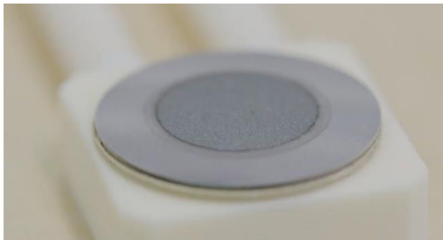
図 金属支持型固体酸化燃料電池セル

環境エネルギー問題を解決し、持続可能な社会を実現することは、現在の研究者・技術者に課せられた大きな課題です。我々の研究室では、これらの問題の解決に資する、燃料電池、電解セル、蓄電池など環境にやさしいエネルギー変換デバイスの実現・普及のための基盤研究を行っています。特に、固体でありながらその中をイオンが高速移動できる「固体イオニクス材料」に着目し、イオン輸送、界面反応、欠陥構造についての学理を探究すると共に、それに基づく機能設計、材料開発を行っています。また、固体イオニクスデバイスにおける材料、反応に関わる理解を深化させるため、使用環境下でのその場測定を可能とする分析技術の開発も行っています。これらの研究を通し、固体イオニクス材料を利用した環境調和型エネルギー変換デバイスの開発ならびに高性能化・高信頼性化に実験、計算の両面から取り組むことで、カーボンニュートラル社会の実現に貢献したいと考えています。