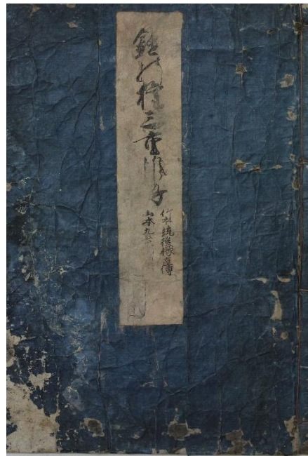
近松門左衛門作『鑓の権三重帷子（やりのごんざかさねかたびら）』 1717年初演。島根大学法文学部蔵 夫婦、家族、職業などの問題に関わる、人の心情や生活を描き出している。