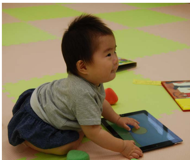
※実験や観察場面の様子